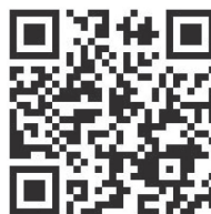
高松港湾・空港整備事務所HP

第六管区海上保安本部 備讃瀬戸海上交通センター TEL : 0877-49-2220 URL : https://www6.kaiho.mlit.go.jp/bisan/